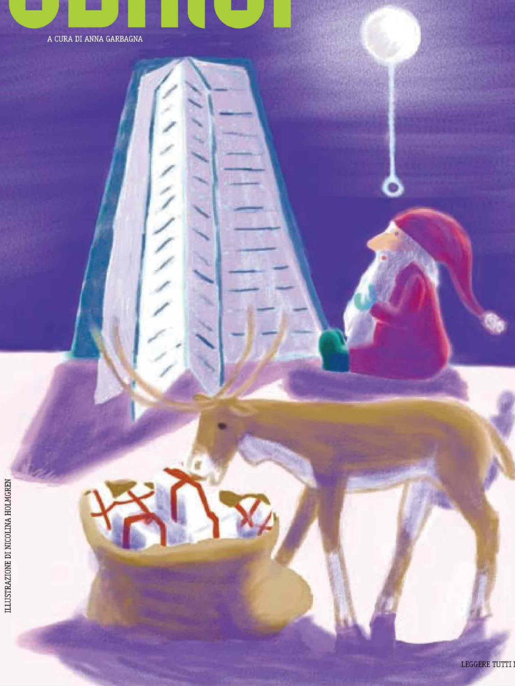
ILLUSTRAZIONE DI NICOLINA HOLMGREN